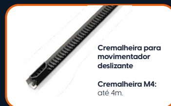
Cremalheira para movimentador deslizante